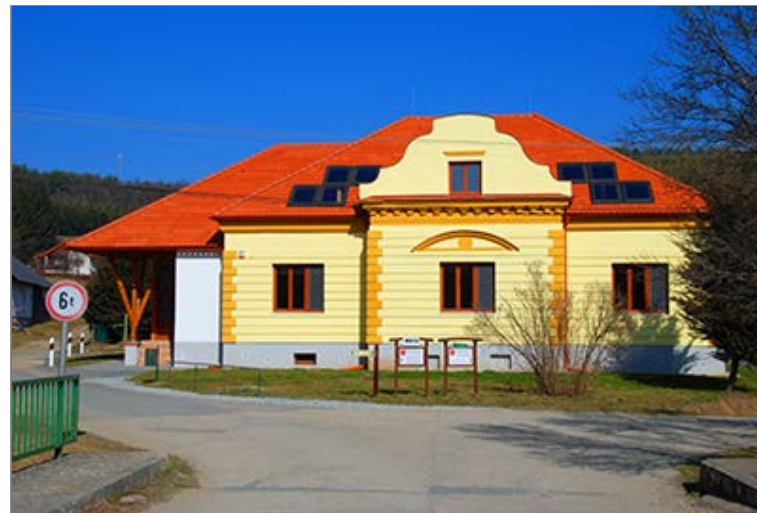
Kultúrház (Művelődési ház) [Kulturni dom] Felsőszölnök [Gornji Senik / Oberzemming]

Kiindulópontunk Felsőszölnökön [Gornji Senik / Oberzemming] a Kern kocsmá [Gostilna] (Rajt) . A Templom úton [Cerkvena pot] a Szalagozást követve teszünk néhány lépést északra, majd a szemből (a Fő út [Glavna cesta] felől) érkező Őrvidéki Piros Túra (piros sáv) jelzése alapján befordulunk balra (a Templom út is erre folytatódik). Átkelünk a Szölnöki-patak hídján és a Kultúrház (Művelődési ház) [Kulturni dom] előtt ismét balra térünk a Hármashatár úton [Pot do tromejnika]. A szintén erre vezető és a Hampó-völgy élővilágát bemutató Hármashatár tanösvény elkísér bennünket a Hármashatárkőig [Tromejník / Dreiländereck]. (A jobbra kezdődő Alsójánoshegyi út [Pod do spodnjega Janezovega brega] felvezet az Alsó-Jánoshegyre [Spodnji Janezov breg], utunk későbbi szakaszára). Nemsokára a Felsőjánoshegyi út [Pod do zgornjega Janezovega brega] tér el a Felső-Jánoshegy [Zgornji Janezov breg] felé, amit később szintén érintünk. A jellegzetes szórványtelepülésen lassan emelkedő utcán turistaút-elágazáshoz érünk. Az Őrvidéki Piros Túra jelzése innen meredeken felvezet a Felső-Jánoshegyre.