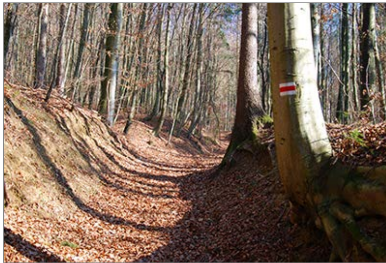
Az Őrvidéki Piros Túra útvonala a Mala Polovna nyugati oldalában

Itt elválunk a Szentgotthárd felé továbbvezető Őrvidéki Piros Túra útvonalától és a Szalagozást követve a gerincen haladó földúton jobbra kanyarodunk. A Mala Polovna keskeny hátán lassan tovább emelkedünk, majd egy útcsomópontban jobb talajútra jutunk. A hangulatos fenyvesben "oldalazó" úton érkezünk meg az egykori "Felsőszölnöki miseút" nyomvonalán futó, 2014. január 10-én átadott, Kétvölgy - Felsőszölnök között vezető összekötő úthoz. Politikai és környezetvédelmi okokból az útépités jogszerűségét a mai napi is többen megkérdőjelezzik, sőt, le nem zárult bírósági eljárás is folyamatban van az új úttal kapcsolatban.