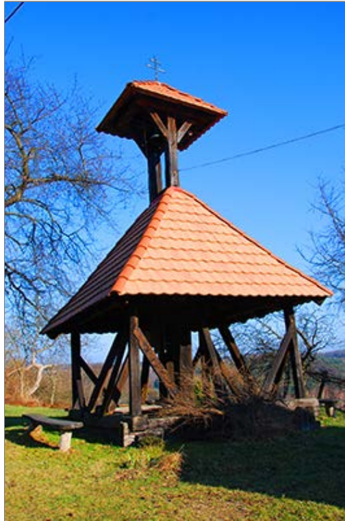
Szoknyás harangláb Kétvölgy (Ritkaháza, Ritkaróc) [Verica-Ritkarovci]

Az úton balra kanyarodva pár lépés után az Őrvidéki Piros Túra csatlakozásához érünk, amely jobbról, Felsőszölnök felől, a "Venci útján" érkezik. A (most már jelzett) műúton, egy tanya mellett elhaladva és lassan kelet, majd északkelet felé kanyarodva megkerüljük a Szakony-patak völgyfőjét. Eközben ha egy tisztásnál jobbra tekintünk, a fák koronája fölött egy pillanatra fetűnik a permisei víztorony és a katalin-hegyi kilátó is. Egy jobb kanyar után érkező a Kétvölgy [Verica-Ritkarovci] szélén lévő turistaút-elágazáshoz. Az itt kiágazó Piros kereszt turistajelzés továbbra is a műutat követi, majd a Szakony-patak völgyét nyugatról kísérő hegyháton Alsószölnökre vezet. Mi azonban az Őrvidéki Piros Túra és a Kétvölgy környékének természeti és kultúrtörténeti értékeit bemutató Réti orchideák tanösvény alapján jobbra fordulunk. A néhány métert emelkedő talajúton, a kis kápolna mellett elhaladva érkezünk meg a kétvölgyi, pontosabban a ritkaházai "Szoknyás haranglábhoz" (Zvonik) (Ritkaháza vagy Ritkaróc [Ritkarovci] Kétvölgy nyugati településrésze).