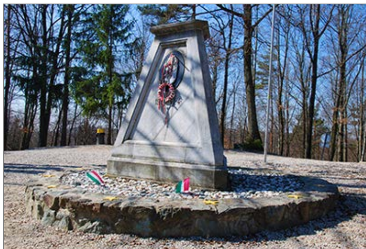
Emlékmű a magyar-szlovén-osztrák Hármashatáron [Hármashatárkő / Tromejník / Dreländereck]

Az ellenőrzőpontot nyugat felé ereszkedő talajúton hagyjuk el, a szlovén-osztrák államhatárt követve, a Burgenland-Weitwanderweg és az Ostösterreich-Grenzlandweg (07) osztrák turistajelzések alapján. Hamarosan útelágazáshoz érünk. Az Ostösterreich-Grenzlandweg (07) jelzés Kölbereck irányába vezet tovább, mi azonban a jobbra kanyarodunk a Burgenland-Weitwanderweg jelzésen Rábaőr [Oberdrosen] felé. Most már Ausztriában vagyunk. Egy esőháznál újabb elágazáshoz érkezünk. Itt elhagyjuk a Burgenland-Weitwanderweg turistajelzést és a Grünes Band tematikus útvonalán ( Themenweg Grünes Band ) jobbra, a táblával jelzett irányba, Eisenberg an der Raab (Rábaszentmárton [Sankt Martin an der Raab] városrésze) felé fordulunk. Széles talajúton haladunk tovább a Holzmannkogel (392,1 m) déli oldalában. Alattunk a Szölnöki-patak északi (egyben egyetlen ausztriai) oldalvölgye [Cemingraben], melyet délről a Hármashatár északkeleti gerince kísért (ezen vezet a magyar-osztrák államhatár). Enyhe kanyarokkal érünk fel a Holzmannkogel keleti, lapos nyergében lévő lalajút elágazáshoz. Itt elhagyjuk a talajutat és a jobbra kezdődő, ösvényszerű földúton lassan a Szetecs-jarek erdejébe emelkedünk, az osztrák Piros sáv jelzést követve. A Hampó-völgyből induló meredek nyiladékban érkezik fel jobbról hamarosan a magyar-osztrák államhatár és a Vasfüggöny túraútvonal .