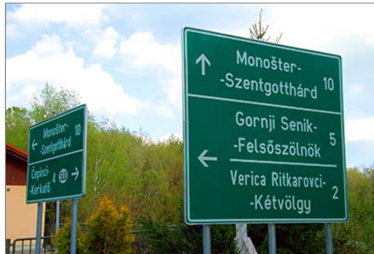
Az új Kétvölgy - Felsőszölnök összekötő út jelzőtáblái (Egykori határállomás - Kétvölgy [Verica-Ritkarovci])