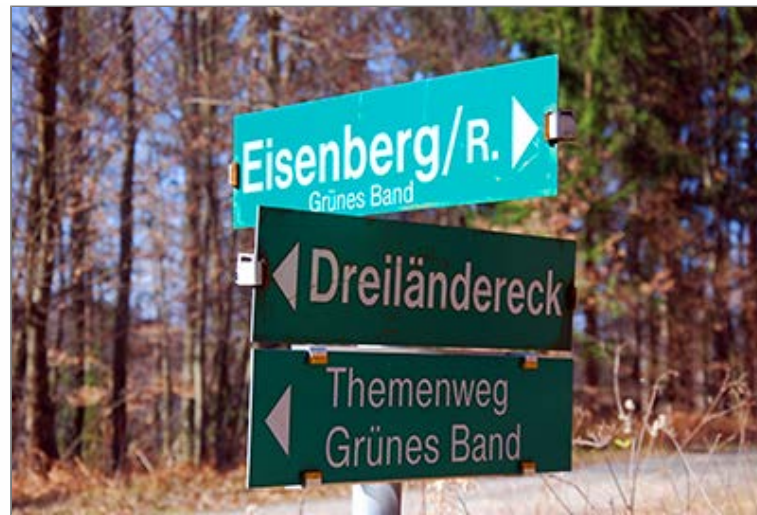
Útelágazás a Holzmannkogel alatt

Az államhatárt kísérő Vasfüggöny túraútvonal jelzésein folytatjuk utunkat északkeleti irányban, néhol a Szetecs-jarek - Szetecsi-dűlő gerincén, néhol annak oldalában. Így érkezünk a Zöld Öv Kezdeményezés 2. állomására [Iniative Grünes Band / Iniciativa Zelena vez, Station 2], az Élmenytisztásra [Erlebnisplatz / Kraj doživetja], ahol megtekinthetünk egy egykori határőrtornyot. Ezután jelzésünk gyönyörű "oldalúton" megkerüli a Miklia-völgy "főjét", majd elhagyjuk az államhatárt, amely meredeken leereszkedik egy észak felé tartó völgybe. Kis fenyvesnél visszakanyarodunk Magyarországra és a Sztara-Bukonya nyergén átkelve kiérünk az erdő szélére. A közigazgatásilag Felsőszölnökhöz tartozó Felső-Jánoshegy szétszórt épületei között, egy fészületnél útelágazáshoz érkezünk. Az itt jobbról, Felsőszölnök felől csatlakozó Őrvidéki Piros Túra jelzéssel együtt követjük tovább a Vasfüggöny túraútvonalat . A Felsőjánoshegyi úton nemsokára újabb elágazást érünk el (Felső-Jánoshegy és Alsó-Jánoshegy határa, útjelző tábla). Itt a két jelzés alapján balra, az Alsó-Jánoshegy irányába fordulunk. Rövid emelkedővel elmegyünk egy újabb, szépen felújított fészület mellett és hamarosan megérkezünk a Janka-hegynek is nevezett János-hegyre [Janezov breg], a kilátóhoz (2. Ellenőrzőpont) .