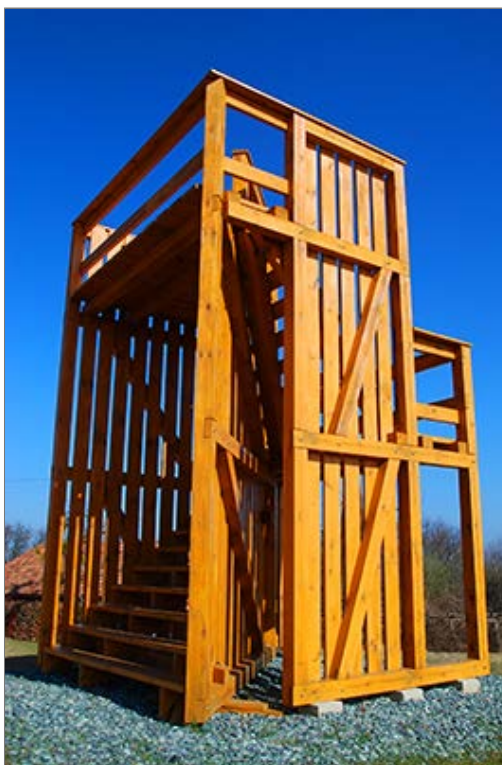
Kilátó Felsőszölnök, János-hegy [Gornji Senik / Oberzemming, Janezov breg]

Az ellenőrzőpont után az Alsó-Jánoshegyen észak felé kanyarodó talajúton folytatjuk utunkat az Őrvidéki Piros Túra és a Vasfüggöny túraútvonal alapján (Közvetlenül a kilátó alatt találjuk a "Piros kulcsosház a lugasnál" és a "Kulcsosház a körtefánál" nevű hangulatos szálláshelyeket). Utunk a szórványtelepülésen nagy kanyart leírva az erdőben ereszkedik tovább a János-hegy keleti gerincén. Egy újabb műemlék fészületnél jobbra az Alsójánoshegyi út ágazik ki. A Vendvidék 12 teljesítménytúra ezen az úton tér vissza Felsőszölnökre. Mi azonban a fészulettől balra folytatódó Őrvidéki Piros Túra és a Vasfüggöny túraútvonal eddig követett jelzésein folytatjuk túránkat. Az Alsó-Jánoshegyen újabb elágazást hagyunk el és a házak között ereszkedve lassan az erdő széléhez érkezünk. Itt elválunk a Vasfüggöny túraútvonaltól , amely az útvilla bal oldali ágán vezet tovább Alsószölnök [Dolnji Senik / Unterzemming] felé.