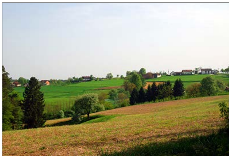
Vendvidéki táj Sal (Kerkafő, Csöpinč) [Občina Šalovci (Čepinci)] határában

Mi azonban az itt kiágazó Zöld kereszt jelzésre térünk át, amely jobbra indul egy ösvényen. A "vasfüggöny" nyomvonalán teszünk néhány lépést (szinte visszafelé), majd balra a bükkerdőbe fordulunk egy földúton. Egy patak völgyfője fölött haladunk a magasabb hegységeket idéző (páfrányos) hegyoldalban. Kis idő múlva jelzésünk becsatlakozik az Őrvidéki Piros Túra útvonalába, amely Kétvölgy felől a "Venci útján" át érkezik fel a völgyből. Innen kezdve ezt a jelzést követjük Felsőszölnökig. A bükkös-fenyves vegyes erdőben nemsokára egy ösvényre térünk rá, amely kivezet bennünket a Felsőszölnökről érkező széles talajúthoz. Ezen jobbra térve nemsokára a községhez tartozó Kakasdomb [Grbenjšnjek] házaihoz érünk (jobbra fészület). Innen nem követjük tovább a talajutat, hanem a kerítés mentén balra kiágazó földúton ereszkedni kezdünk a Szerelem-völgy irányába. Leérve egy újabb talajútra, ezen jobbra haladunk tovább a völgyfő fölött. Az oldalban észak, majd északnyugat felé kanyarodó úton lassan ereszkedünk, majd az elkeskenyedő háton egy-két jellegtelen nyeret hagyunk magunk mögött. Szétszórt házak között érünk fel a Kakas-domb "tetejére", ahol utunk élesen balra kanyarodik és egy mélyútban a domb lapos, füves, nyugati nyergébe ereszkedik le.