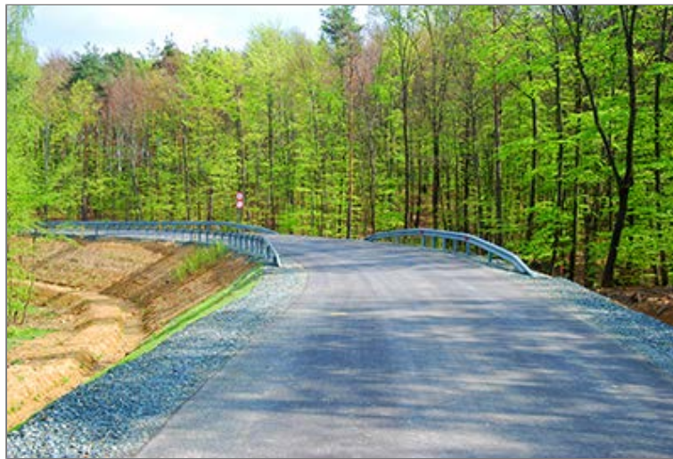
A 2014-ben átadott Kétvölgy - Felsőszölnök összekötő út eredeti térszínhez képest megemelt nyomvonala

Itt elválunk a Szentgotthárd felé továbbvezető Őrvidéki Piros Túra útvonalától és a Szalagozást követve a gerincen haladó földúton jobbra kanyarodunk. A Mala Polovna keskeny hátán lassan tovább emelkedünk, majd egy útcsomópontban jobb talajútra jutunk. A hangulatos fenyvesben "oldalazó" úton érkezünk meg az egykori "Felsőszölnöki miseút" nyomvonalán futó, 2014. január 10-én átadott, Kétvölgy - Felsőszölnök között vezető összekötő úthoz. Politikai és környezetvédelmi okokból az útépités jogszerűségét a mai napi is többen megkérdőjelezzik, sőt, le nem zárult bírósági eljárás is folyamatban van az új úttal kapcsolatban.