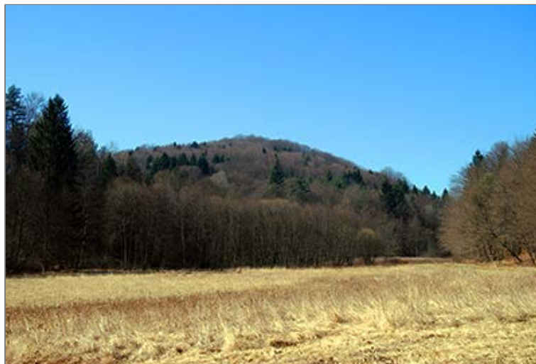
A Hampó-völgy részlete

alapján. Ez a jelzés egészen a Hármashatárig lesz a kísérőnk. A nyugati irányba húzódó völgyet észak felől a Gropcsica - Sztara-Bukonya, dél felől a Karecs-jarek - Jakobi-jarek meredek hegyorrai szegélyezik. A Miklia-völgy torkolata után hamarosan elhagyjuk a település utolsó - és egyben a mai Magyarország legnyugatibb - lakóépületeit. Most már a Szölnöki-patak legfelső szakaszán, a Hampó-völgyben járunk. Kényelmes talajutunk az egyre jobban összeszűkülő völgy északi peremén, a Szetecsi-dűlő - Szetecs-jarek aljában vezet. A patak a völgy túloldalán, a Szölnöki-erdő és a Gubics-hegy (369,3 m) aljában kanyarog. A Halál-völgy, majd egy névtelen déli oldalvölgy torkolata után a Hampó-völgy tisztásának felső, nyugati végébe érkezünk (magyar-osztrák államhatár).