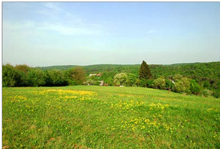
A Kakas-domb füves hátát a környező magasabb dombok szegélyezik

Az Őrvidéki Piros Túra alapján a szemközti telket jobbról megkerülő ösvényen folytatjuk utunkat. A Kakas-domb nyugati hegyorrának északi peremén vezet utunk, az erdő szélét követve. Nemsokára balra térünk és elérve a gerincet, igen meredek, gyökeres ösvényen ereszkedünk lefelé, miközben szép rálátásunk nyílik a völgyben meghúzódó Felsőszőlőkre és annak templomára. Egy kert mellett jutunk le a Fő úthoz, melyet a Szerelem-völgy patakjának hídjánál érünk el. Átkelünk a hídon és elhagyva a jobbra kanyarodó Őrvidéki Piros Túra jelzését, a Szalagozást követve, egyenesen a Templom úton érjük el a Kern kocsmát [Gostilna] , túránk Céját.