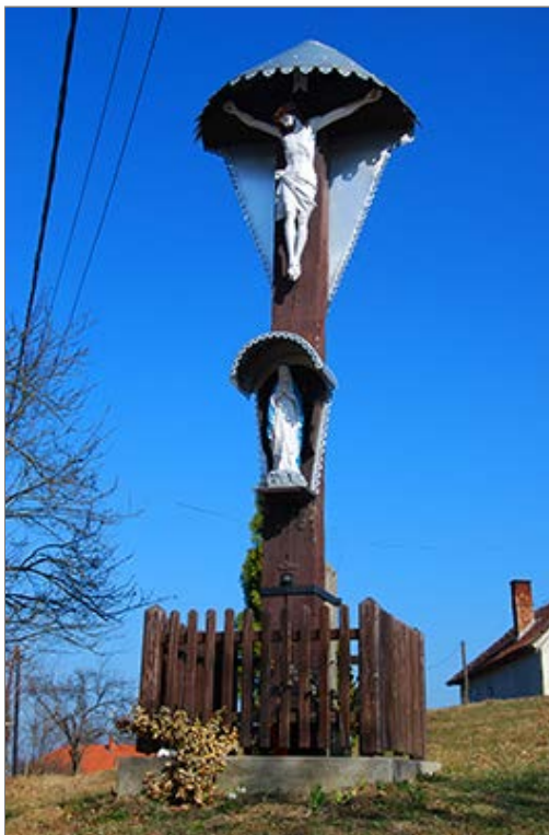
Műemlék feszület Felsőszölnök (Alsó-Jánoshegy) [Gornji Senik / Oberzemming (Spodnji Janezov breg)]

Innen a jobbra folytatódó Őrvidéki Piros Túrán haladunk tovább. Figyeljünk, mert a jelzés nemsokára a talajútról balra betér a fenyvesbe! A jelzett ösvény eleinte a fiatalos szélén, majd gyönyörű bükkerdőben, egyre meredekebben ereszkedik le a Szölnöki-patak völgyébe. A völgy pereménél érjük el a Malom utat [Mlinska pot], amelyen balra fordulunk. Átkelünk a Szölnöki-patak hídján és Felőszölnök Békaváros nevű településrészén, az egykori vízimalomnál a Fő úton ismét balra, Szentgotthárd [Monostur - Senkotar / Monoštar / Sankt Gotthard] felé kanyarodunk. A szétszórt épületek mentén vezető kanyargós úton egy patak kis hídjág megyünk, amely után azonnal jobbra befordulunk egy ház udvarába. Az Őrvidéki Piros Túra jelzése átvezet a kerten (természetesen engedéllyel és a tulajdonossal egyeztetve). Kiemelten felhívjuk a figyelmet arra, hogy az ingatlan MAGÁNTERÜLET, ezért kérünk mindenkit, hogy a kulturált viselkedés szabályait betartva és "civilizált emberként" haladjon át az udvaron!!! A völgy keleti pereménél lépünk be a szálerdőbe és az impozáns bükkösben meredeken emelkedni kezdünk. Az eleinte határozott földút később bizonytalanabbá válik, ezért figyeljük a jelzéseket, melyeket követve a hegyoldalba kanyarodunk! Lassú emelkedővel érünk fel a Felsőszölnököt Kétvölgytől elválasztó gerincre, a Mala Polovna nyergébe.